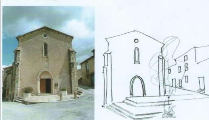
LE PARVIS DE L'EGLISE

Info : au dernier recensement de 2017 nous sommes 240 habitants dans notre commune