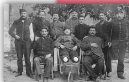
Soldats de Villarzel Cabardés ayant participés à la 1 ère Guerre Mondiale