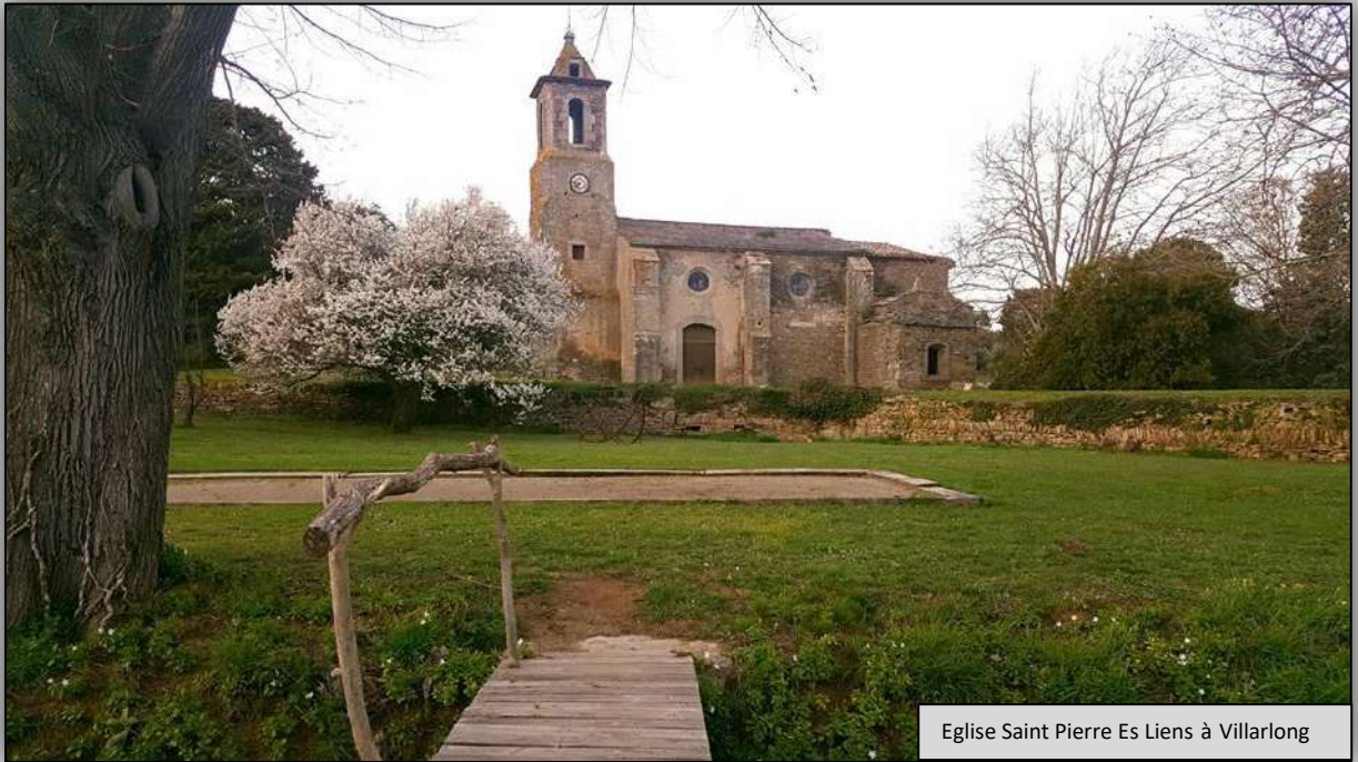
Eglise Saint Pierre Es Liens à Villarlong