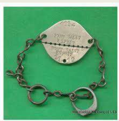
Exemple de fiche matricule